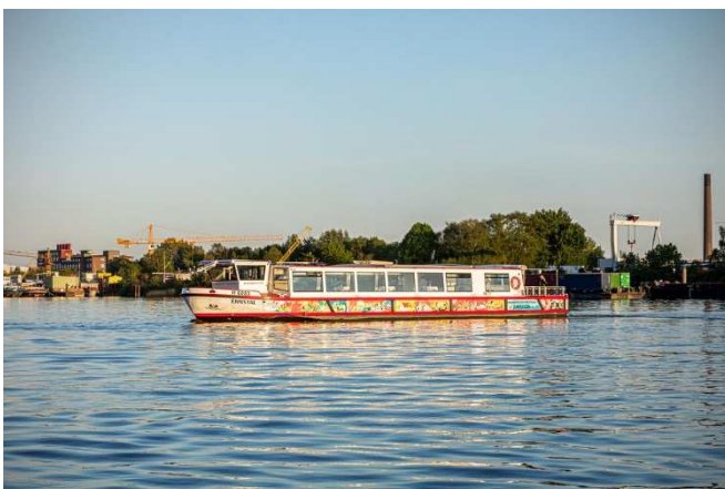
Barkassenfahrt zur neuen Bahnbrücke Kattwyk

Nach dem großen wechselseitigen Erfolgen der Besichtigung von Ingenieurs- und maritimen Bauwerken wird diesmal mit einer Barkasse die neue Bahnbrücke Kattwyk besichtigt.